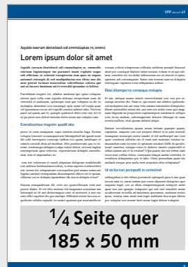
1/4 Seite quer im Innenteil (185 x 50 mm), 4c 280,- €