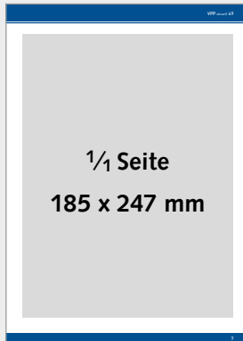
Ganze Seite im Innenteil (185 x 247 mm), 4c 980,- €